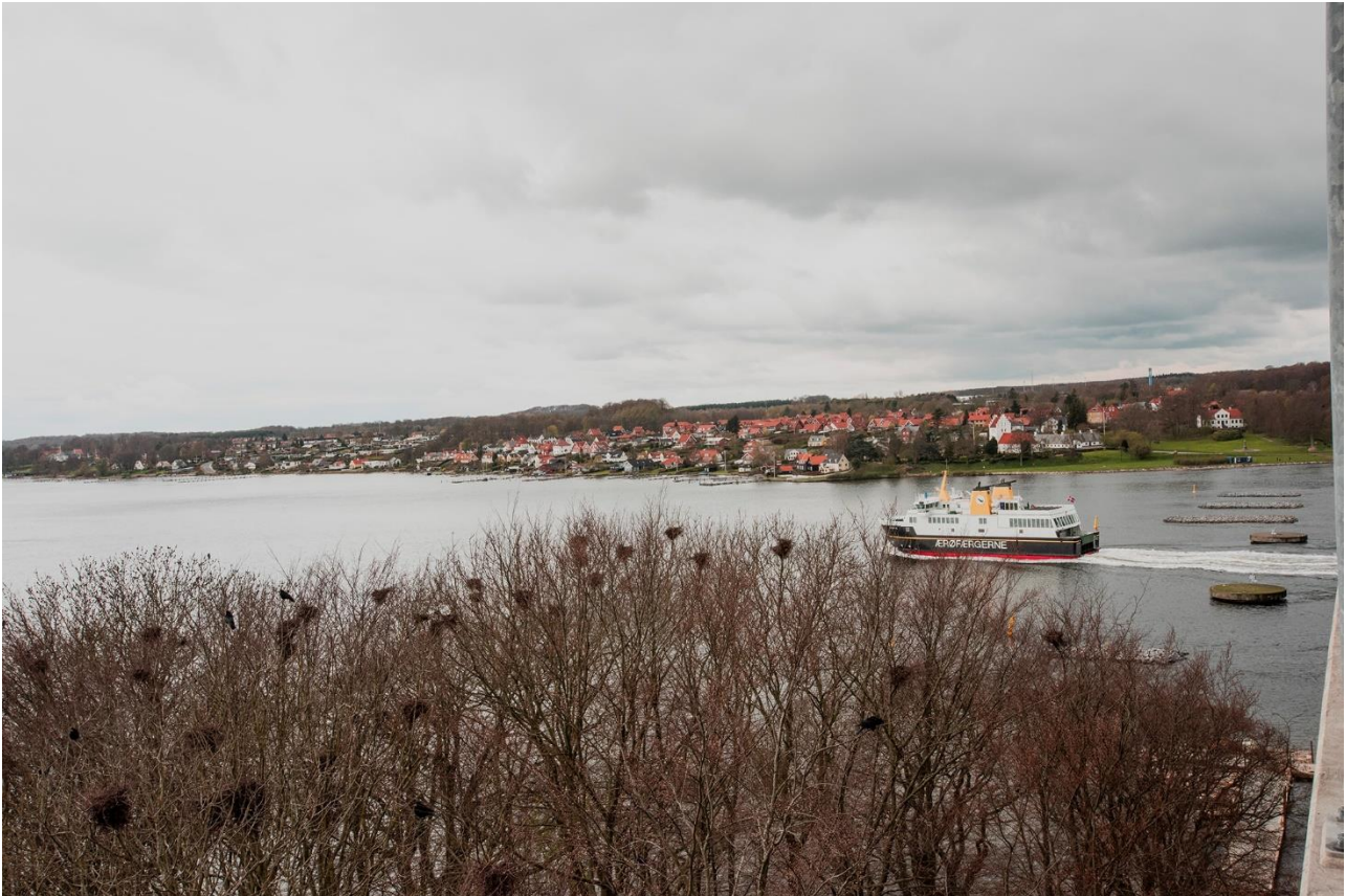
Mange af Rågekolonierne er placeret i kystnære skove. Her er kolonien i Braten Skov i bøg (og ask) vest for Svendborgsundbroen. På den østsiden vokser kolonien nu ud af bøgeskoven og ind i en tilstødende ahornbevoksning. Kolonien kan ses både fra broen og fra færgen til Ærø.