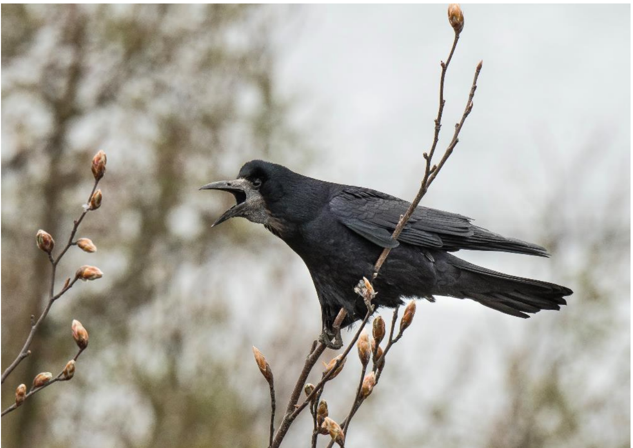
Her er en Råge godt i gang med at hævde territorium i nærheden af reden. Bøgekopperne er endnu ikke bristet.

Jeg har nu fulgt de svendborgensiske Rågekolonier gennem mere end 20 år. Det var dengang Svendborg Kommune dækkede 173 km 2 . Senere blev Gudme og Egebjerg kommuner ved kommunalreformen i 2007 opslugt i storkommunen Svendborg, som i dag dækker et areal på 415 km 2 . For sammenligningens skyld har jeg har fortsat optællingen indenfor de gamle kommunegrænser. Måske også lidt af mageligheds grunde, da jeg foretager mine optællingsture på cykel, så at dække 173 km 2 er såmænd nok. Alligevel tager det lang tid, for mens der var 20 kolonier i 2004, så sker der hele tiden en udvikling: Mange kolonier er enten flyttet, blevet opgivet eller er nyetablerede, så selvom der i 2024 reelt er beboet det samme antal, har der i alle de mellemliggende år været Rågebeboelse på ikke færre end 60 lokaliteter. De må alle besøges, da opgivne kolonier kan gendannes og genopstå efter en periode. På den måde farer jeg kommunen rundt på cykel fra slutningen af marts og en måneds tid frem. I år påbegyndte jeg mine optællinger i kolonierne allerede den 17. marts. Da var Rågerne meget aktive i kolonierne, og for første gang blev jeg færdig på min rundtur i kommunen allerede før april, dog blev enkelte kolonier eftertjekket i april. Den tidlige aktivitet kan være et tegn på, at yngleperioden er fremrykket. Måske begynder Rågerne nu tidligere på grund af klimaændringer.