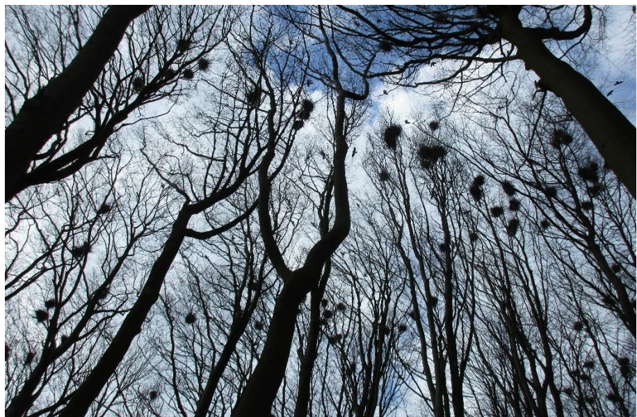
Kolonien i Rubjergskoven, en af de konstante og tilbageværende store kolonier i en kystnær bøgeskov mellem Svendborg og Skårupøre: Foto: Niels Andersen

Det er selvfølgelig ikke helt i overensstemmelse med sandheden at kalde det en koloni, hvis der blot er tale om en enkelt rede. Og mange kolonier er ganske små. Ofte udvikler de sig, hvis der er potentiale til det. Det er dog en klar tendens, at få store kolonier i skovebevoksninger bliver afløst af flere små kolonier i trægrupper. Det er det forhold, der gør sig gældende når antallet af reder er blevet halveret over de seneste 15 år, samtidig med at antallet af kolonier har holdt sig