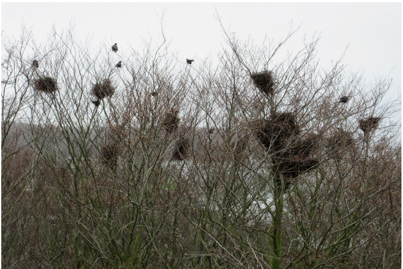
Beboet koloni i Braten Skov på Tåsinge. Der er fuld aktivitet i kolonien 5. april 2024. Kun 6 kolonier har været beboet alle årene. Braten-kolonien er ikke en af dem, men den er i 2024 den største med 166 reder.

Mine optællinger foregår ved, at jeg går rundt i skoven og noterer træart og redeantal ned: B 3, Eg 2, Ah 1 i notesbogen betyder fx tre reder i en bøg og to reder i en eg og en rede i en ahorn. På den måde kan det