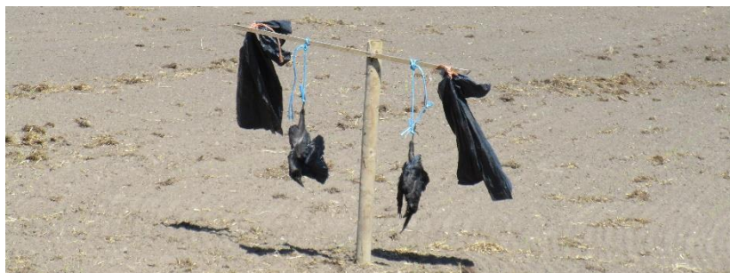
Døde Råger brugt som skræmmefugle på Sydlangeland ved nylig tilsået majsmark.

Rågen er siden kulminationen i 2009 stort set uden undtagelse gået tilbage i mit undersøgelsesområde, der som nævnt svarer til den gamle Svendborg Kommune. Alligevel bliver der hvert år fra 1. maj til 15. juni drevet jagt på den. Som eneste art jages den i sin yngletid. Jagten er lagt i hænderne på Jægerråd Svendborg og foretages på de unger, der kravler ud af reden og sætter sig i redeomgivelserne. Jagten er